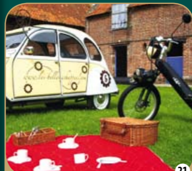
• Les Belles Echappées à Clairmarais Tél. 03 21 98 11 72

Les parcours de 9 ou 18 trous surplombent la Vallée de l'Aa. Un spectacle panoramique, couplé à une atmosphère à la fois chaleureuse, amicale et sportive.