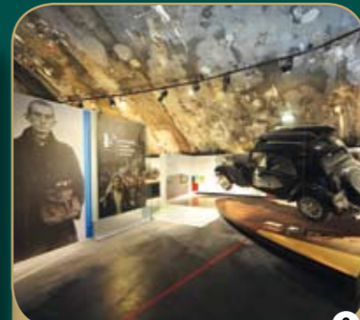
• Coupole d'Helfaut Tél. 03 21 12 27 27