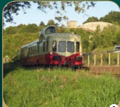
• Office de Tourisme du Pays de Lumbres Tél. 03 21 93 45 46 • Chemin de Fer Touristique Tél. 03 21 12 19 19