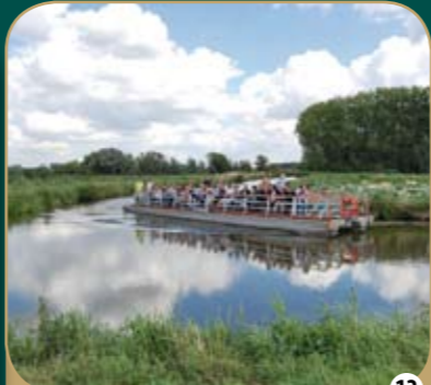
• Isnor Location Tél. 03 21 39 15 15 / 03 21 38 95 70 • Au Bon Accueil Tél. 03 21 38 35 14 • Ville d'Arques « Le Fontinettes » Tél. 03 21 88 59 00