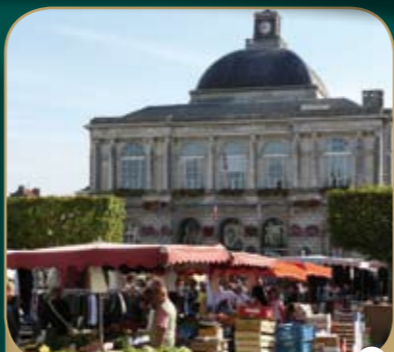
• Office de Tourisme de la Région de Saint-Omer Tél. 03 21 98 08 51