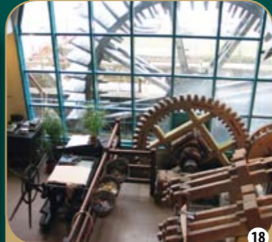
• Maison du Papier à Esquerdes Tél. 03 21 95 45 25