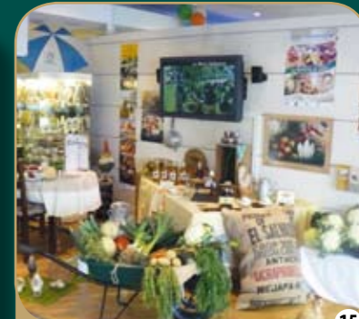
• Office de Tourisme de la Région de Saint-Omer Tél. 03 21 98 08 51

Au cœur du Parc des Caps et Marais d'Opale : 3 700 ha de terre et d'eau, le dernier marais cultivé de France, la Réserve Nationale du Romelaëre à Clairmarais.