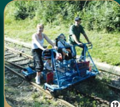
• Rando Rail du Pays de Lumbres Tél. 03 21 88 33 89