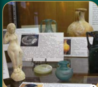
• Office Culturel et Touristique de Therouanne Tél. 03 21 93 81 22

Un superbe hôtel particulier, des collections riches et variées, plus de 3 000 œuvres majeures présentées en trois parcours : Histoire, Beaux Arts et Céramique.