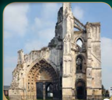
• Service Animation du Patrimoine Tél. 03 21 888 923

22 Aktivurlaub: Geführte Wanderungen, Golf auf dem Bauernhof, Schatzsuche, Fahrradverleih, Quad, Paintball, Inoorkarten, Bowling.