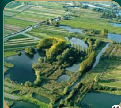
• Maison du Parc Naturel Régional Tél. 03 21 87 90 90

Site monumental (360 000 t de matériaux, 22 m de haut, 1 ha), édifié par les nazis pour y développer leur programme de construction d'armes secrètes.