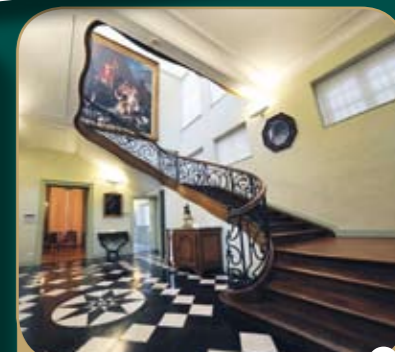
• Musée de l'Hôtel Sandelin de Saint-Omer Tél. 03 21 38 00 94

Parcourez Saint-Omer Ville d'Art et d'Histoire pour vivre des sensations multiples et découvrez la majesté des grandes demeures des XVIII e et XIX e siècles.