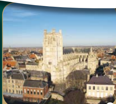
• Office de Tourisme de la Région de Saint-Omer Tél. 03 21 98 08 51