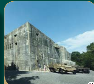
• Blockhaus d'Eperlecques Tél. 03 21 88 44 22

A Therouanne, ancienne capitale de la Morinie, suivez les découvertes des archéologues. A voir au musée : un parchemin portant le sceau de Charles Quint.