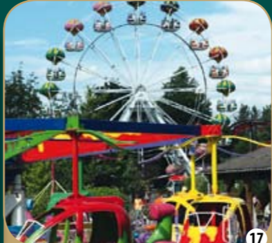
• Dennlys Parc à Dennebroeuq Tél. 03 21 95 11 39