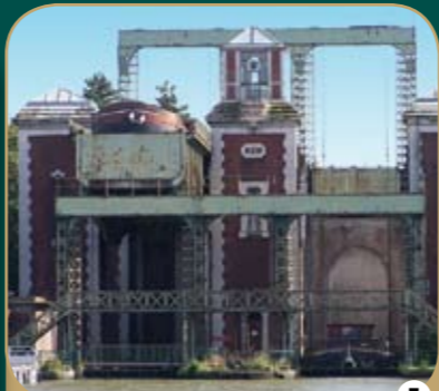
• Maison du Tourisme d'Arques Tél. 03 21 88 59 00