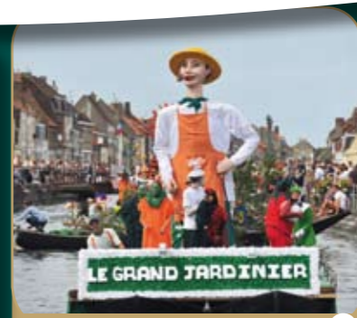
• Office de Tourisme de la Région de Saint-Omer Tél. 03 21 98 08 51