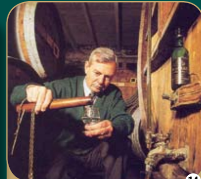
• Distillerie de Houille Tél. 03 21 93 01 71