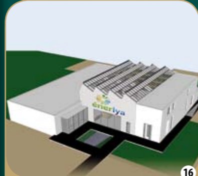
• Enerlya à Fauquemergues Office de Tourisme Tél. 03 21 38 38 51

Les artisans et producteurs locaux partagent leurs savoir-faire traditionnels : brassage de la bière, torréfaction du café et fabrication de produits fermiers.