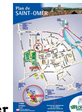
Plan de Saint-Omer