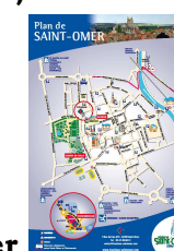
Plan de Saint-Omer