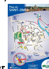
Plan de Saint-Omer